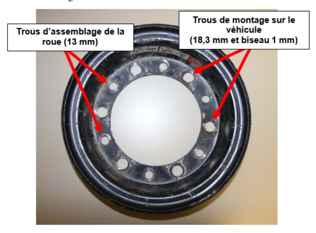
Figure 3 : Comparaison de la grandeur de trous d'assemblage et de montage

Les trous d'assemblage de la jante sont placés en alternance avec les trous servant à monter la roue sur le véhicule (Figure 3). Les trous servant à l'assemblage de la jante ont un diamètre de 13 mm et sont de forme cylindrique. Les trous destinés au montage sur le véhicule sont plus grands, de forme biseautée et ont un diamètre de 18,3 mm sur leur côté le plus grand. Le biseau a une largeur de 1 mm.