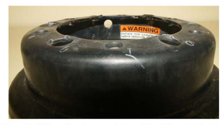
Figure 9 : Déformation des trous de la moitié extérieure de la jante.

L'observation de la moitié extérieure de la roue nous permet de constater que les grands trous sont déformés et montrent un signe d'arrachement du côté qui vient en contact avec l'autre moitié (Figure 9). Le métal y est partiellement déchiré et étiré. De plus, la forme de ces trous, plutôt que d'être ronde, correspond exactement à celle de la tête des boulons d'assemblage (Figure 10).