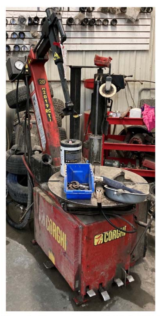
Figure 2 : Monte-pneu Corghi A2019 RC TI

pour gonfler le pneu à la suite de sa réinstallation sur la roue remontée. La pression d'air alimentée à l'appareil est de 1 034 kPa (150 lb/po²). Un autocollant d'avertissement de danger est présent sur l'appareil; on y mentionne notamment le risque d'explosion au moment du gonflage. Ce risque est répété dans le manuel du fabricant de l'appareil.