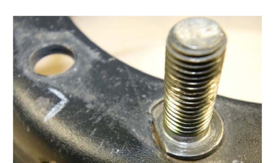
Figure 10 : Tête du boulon dans le trou de montage sur le chariot élévateur, à la suite de l'accident

L'employeur dispose d'une cage de retenue pour le gonflage des pneus de véhicules lourds. Cette cage est entreposée au deuxième étage du garage et n'a pas été déplacée le jour de l'accident. Les travailleurs l'utilisent lorsqu'ils jugent qu'elle est nécessaire lors du gonflage de pneus de grandes dimensions, ce qui est peu fréquent. Aucune consigne n'existe à cet effet.