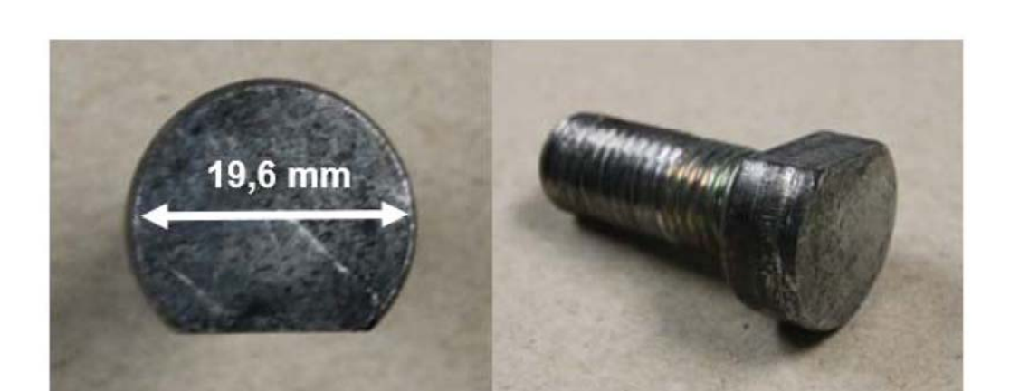
Figure 4 : Tête du boulon d'assemblage de la roue