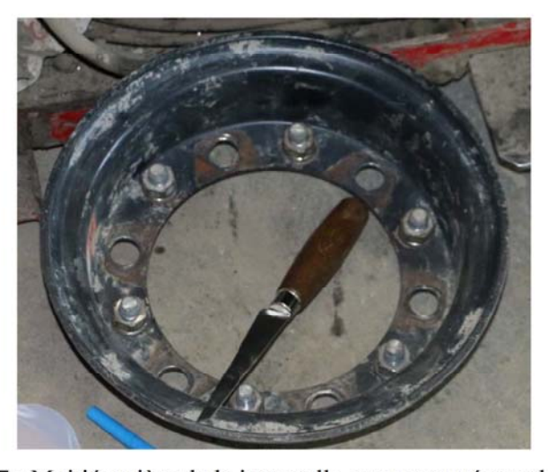
Figure 7 : Moitié arrière de la jante telle que retrouvée sur les lieux

À la suite de l'accident, toutes les composantes de la roue ont été retrouvées sur place. La jante est retrouvée en deux pièces séparées et les boulons d'assemblage sont demeurés attachés sur la moitié arrière de la jante. Les boulons sont retrouvés en bon état et sont encore montés dans les petits trous alternés de la moitié arrière (Figure 7).