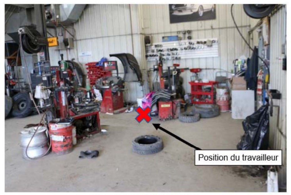
Figure 1 : Lieux de l'accident

Le travailleur décède des suites de ses blessures.