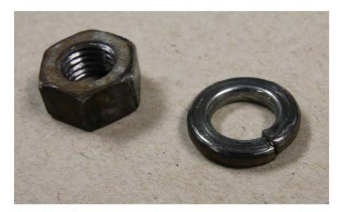
Figure 5 : Écrou et rondelle pour l'assemblage de la roue

Ces boulons sont prévus pour être utilisés avec une rondelle de blocage et un écrou qui doivent être montés à l'arrière de la roue, du côté en contact avec le véhicule (Figure 5).